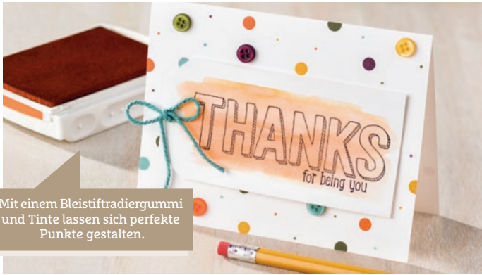
Mit einem Bleistifttradiergummi und Tinte lassen sich perfekte Punkte gestalten.

Für je 60 € | £45 Bestellwert (Katalogpreise ohne Versandkosten) können Sie ein Gratisprodukt wählen! Weitere tolle Produkte, die nur bis zum 31. März erhältlich sind, finden Sie in unserer Sale-A-Bratton Broschüre.